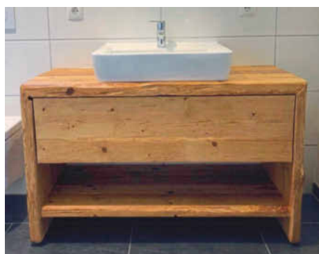
/ Um die authentische Optik zu bewahren, wird das Holz nur behutsam gehobelt oder leicht gebürstet.