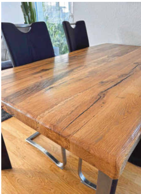
/ Damit immer das passende Holz für die Projekte zur Hand ist, gibt es mittlerweile ein großes Holzlager.